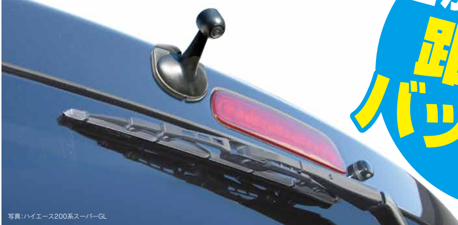
写真:ハイエース200系スーパーGL