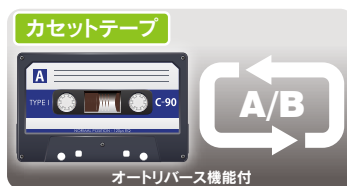
オートリバース機能付