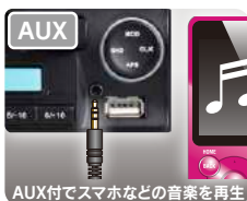
AUX付でスマホなどの音楽を再生