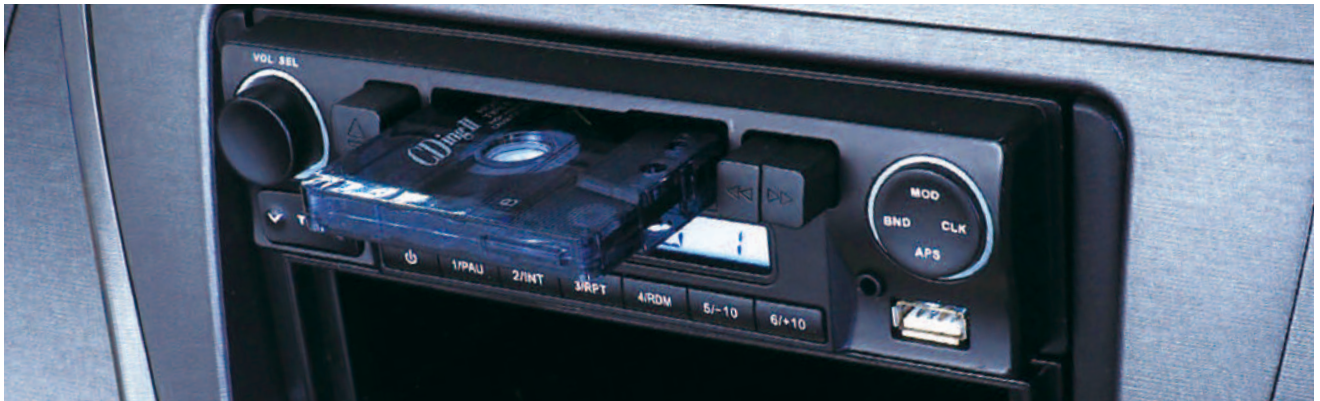
液晶は見る角度により見えにくくなります。