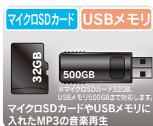
マイクロSDカードやUSBメモリに入れたMP3の音楽再生