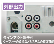
ラインアウト端子付 ウーファーの追加などシステムの拡張可能