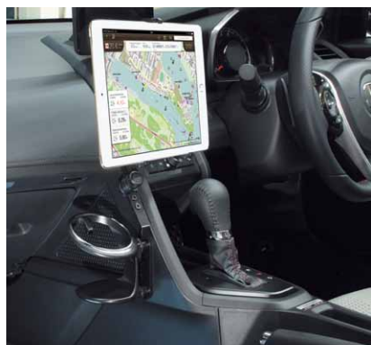
純正ドリンクホルダーあり 純正ドリンクホルダー+QBD32+QBA52