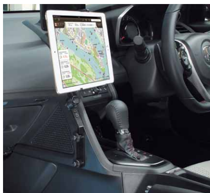
純正ドリンクホルダー無し QBD32+QBA52 (別売)